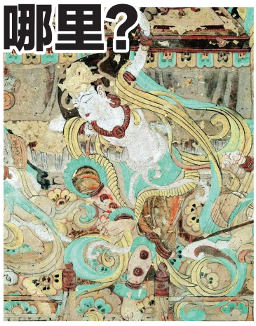
敦煌莫高窟壁画 局部

有一尊长15米余的彩塑像，莫高窟最大的“涅槃佛”，面目安详，仿佛正在假寐。据统计，敦煌莫高窟现存着