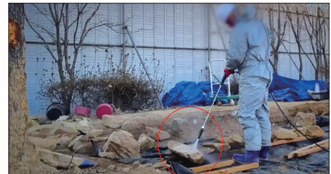
工作人员用高压水枪清洁古墓石块