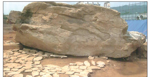
韩国金海支石墓，号称“世界第一大”(资料图)

据韩国JTBC电视台1月30日报道，韩国庆尚南道金海市有一座2000年历史的古墓，号称“世界第一大支石墓”。然而当地政府在组织工作人员修复时，却因操作不慎造成石墓严重受损，令韩国网友心疼不已。