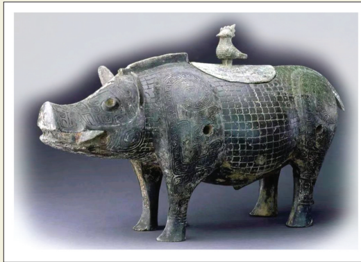
朱氏父子捐赠的猪型青铜器