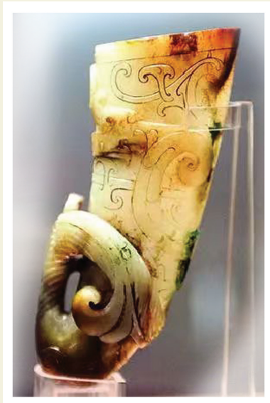
玉角杯 广东南越王墓博物馆藏

中国考古史上很多著名的国宝拥有浓厚的传奇意味,因为它们很多都是在城建、农耕或者开山等作业中无意被发现的。今天要说的这件国宝,就是在挖地基的时候闪耀登场的。