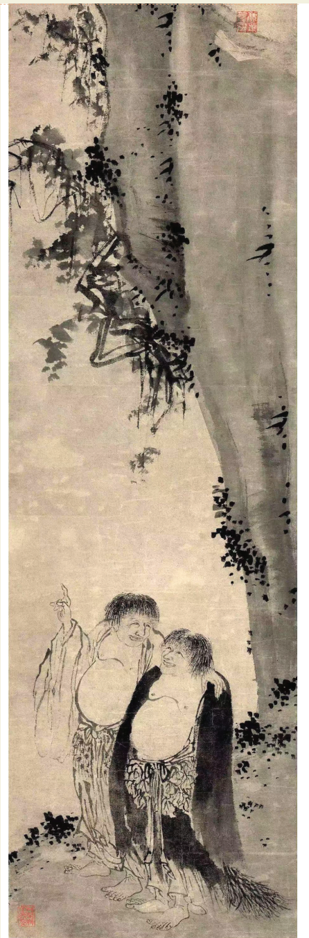
尤求 寒山拾得图 辽宁博物馆藏