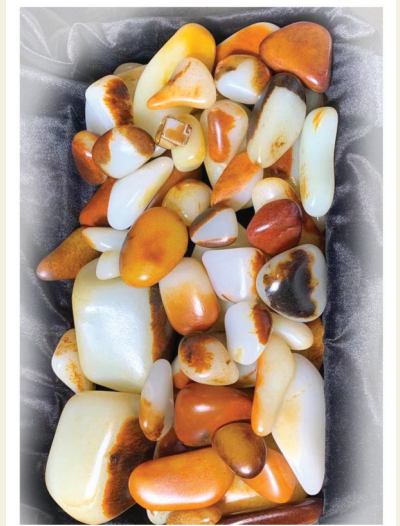
一堆精美的和田玉籽料

如果是肉好、皮好、形不好的就是中等原料，皮好、形好、肉不好的就属于下等原料，而肉、皮、形都不好的则属于劣质的原料。