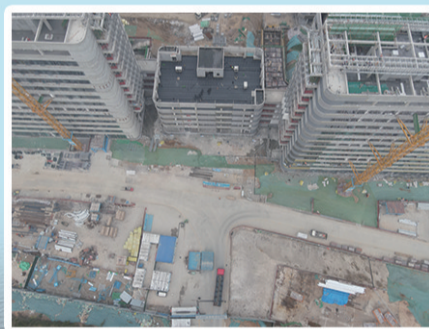
公共临床服务中心