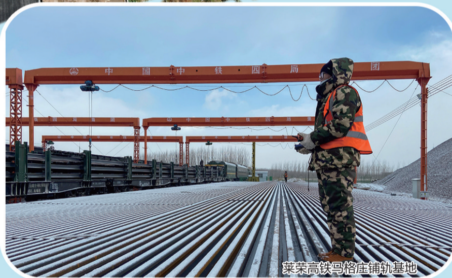
莱荣高铁马格庄铺轨基地