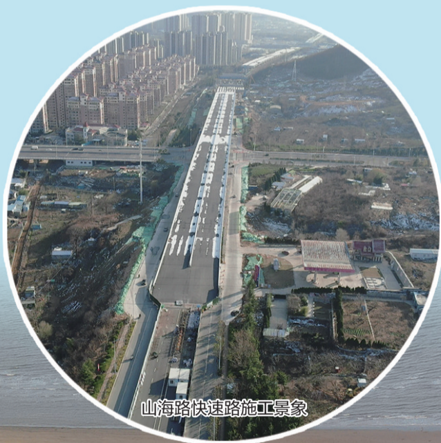
山海路快速路施工景象