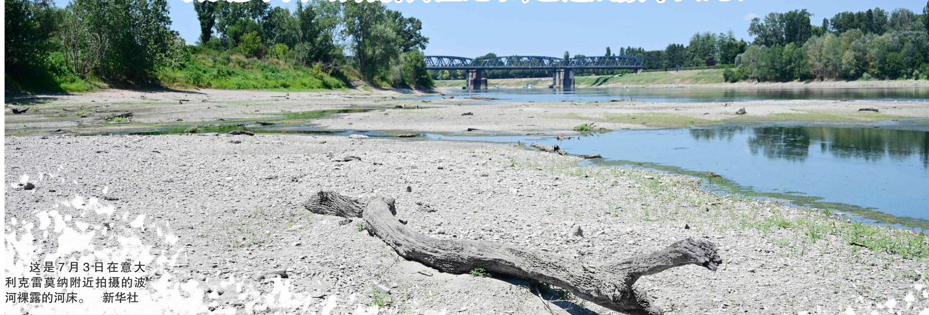
这是7月3日在意大利克雷莫纳附近拍摄的波河裸露的河床。新华社

新华社北京7月4日电 当前,一场热浪席卷美国中部和东部大部分地区,并波及美国建国250周年庆祝活动,首都华盛顿特区及多地已推迟甚至取消数十场游行、音乐会和烟花表演等。