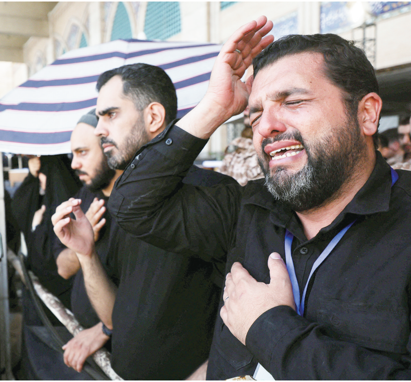
7月4日,在伊朗首都德黑兰,人们参加伊朗已故最高领袖哈梅内伊遗体告别仪式。新华社

新华社德黑兰7月4日电 据伊朗媒体7月4日报道,伊朗已故最高领袖阿里·哈梅内伊遗体告别仪式当天早上开始举行,大批伊朗民众来到位于首都德黑兰的伊玛目霍梅尼清真寺送别。