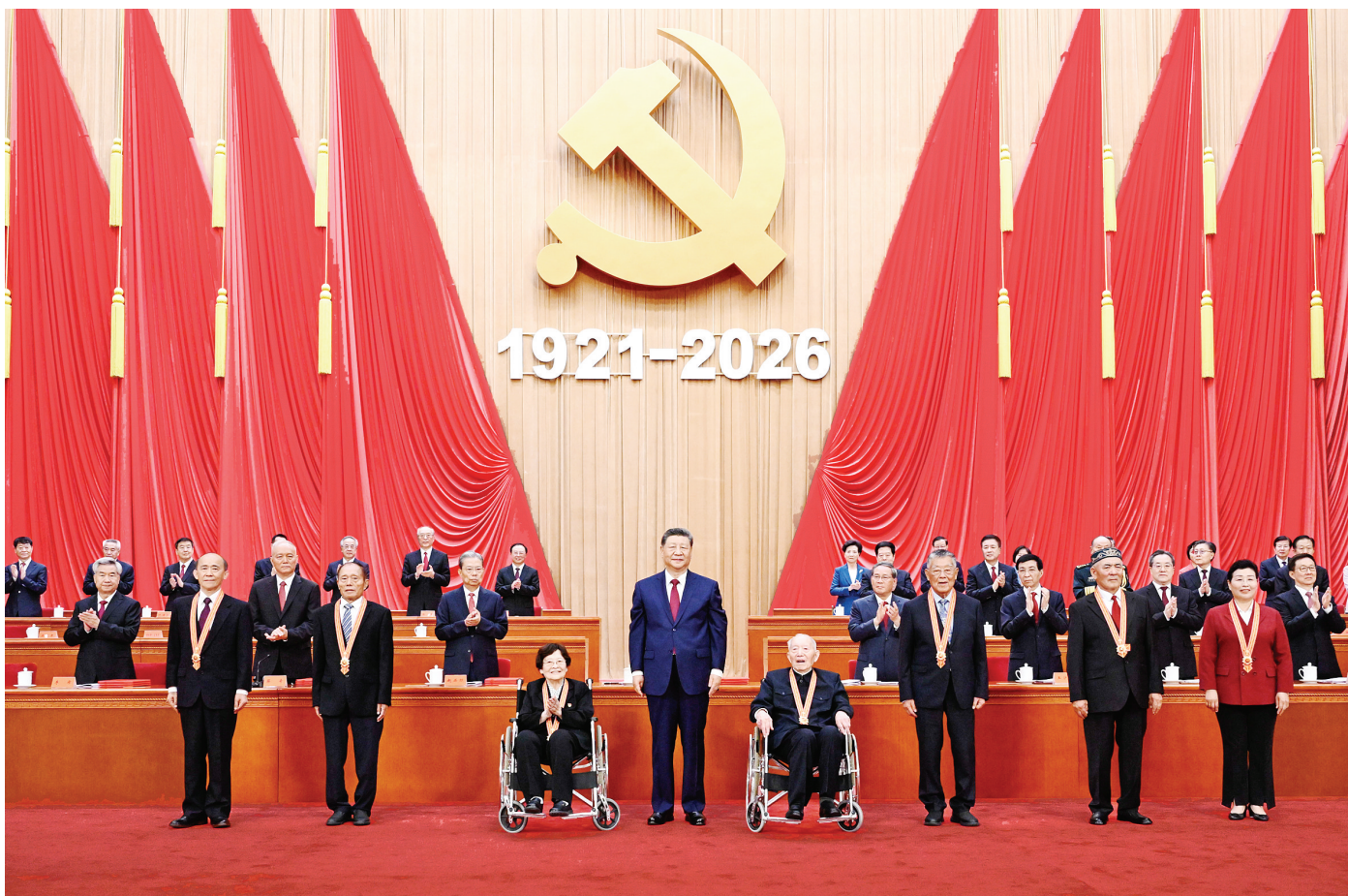
7月1日上午，庆祝中国共产党成立105周年大会在北京人民大会堂隆重举行。中共中央总书记、国家主席、中央军委主席习近平发表重要讲话。