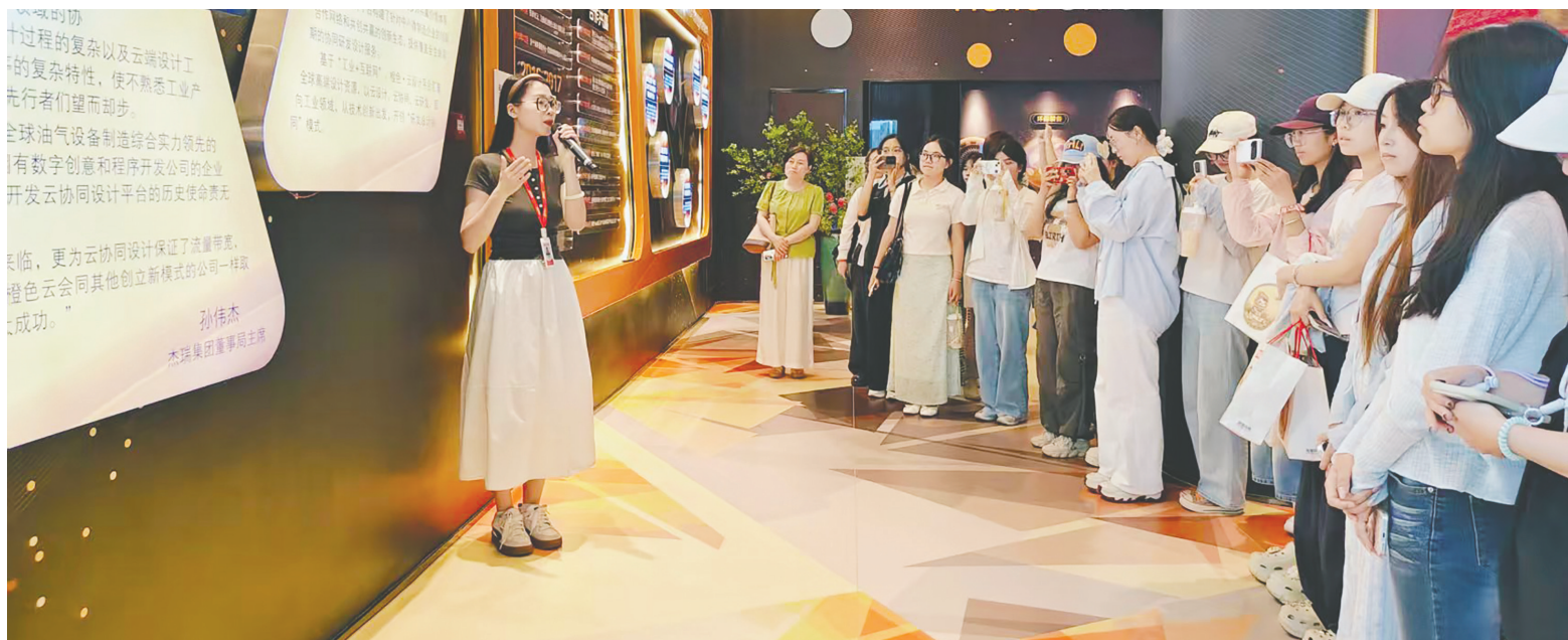
参加实践采访的烟大学生认真聆听讲解。

橙色云是杰瑞联合集团(以下简称“杰瑞”)旗下独立子公司。作为特种工业装备领域的巨头,杰瑞在全球布局有11大研发中心、11个制造基地,吸纳了9000余名专业技术人才,旗下上市板块杰瑞股份,市值已超1500亿元。