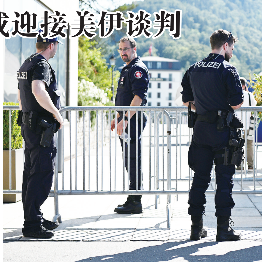
6月21日，在瑞士卢塞恩附近的比尔根山，安保人员在谈判会场外执勤。

目前，美伊双方谈判立场尚存分歧，有关霍尔木兹海峡是否关闭，双方各执一词。21日这场在比尔根山举行的美伊谈判能否顺利进行，仍有待观察。