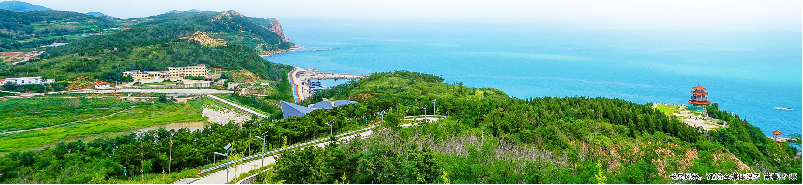
长岛风光。

潮起潮落不息,藏蓝坚守如初。扎根渤海百岛,一代代海岛民警以平凡步履丈量绵长岸线,以初心执念破解治理难题,用数十年坚守,筑牢我国北方沿海生态安全屏障,让长岛这片碧海仙山,绽放动人光彩。