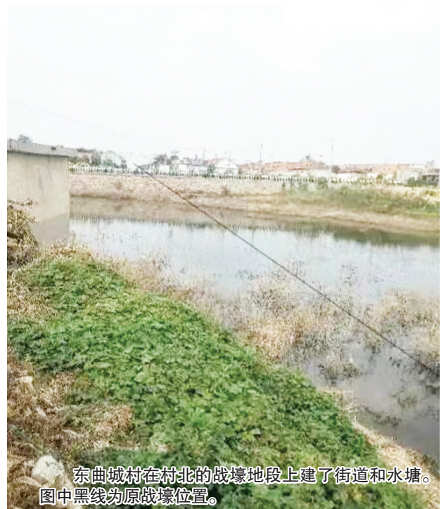
东曲城村在村北的战壕地段上建了街道和水塘。图中黑线为原战壕位置。

有筑壕往事诗句为证：岁月沧桑八十霜，残壕湮没野川长。当年筑垒劳民力，昔日兴工损稼桑。空耗资财无御敌，仓皇溃走尽荒凉。前尘警世千秋记，聚力方安万里疆。