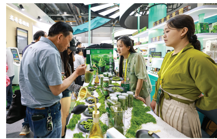
5月21日，观众（左）在第八届中国国际茶博会上品尝抹茶产品。当日，第八届中国国际茶叶博览会在浙江省杭州市开幕。本届博览会吸引1500余家茶企参展。

据新华社北京5月21日电 国家发展改革委21日发布消息，根据国际市场油价变化情况，自5月21日24时起，国内汽油、柴油价格每吨分别上调75元、70元。