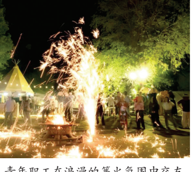
青年职工在浪漫的篝火氛围中交友。

本次活动,是市总工会、市工人文化宫立足青年职工需求,创新交友形式的一次生动实践。活动将露营、烧烤、篝火等青年喜爱的元素融入其中,贴合当代青年的社交习惯,让交友过程更自然、更松弛,也让青年职工感受到工会组织的温暖与关怀。