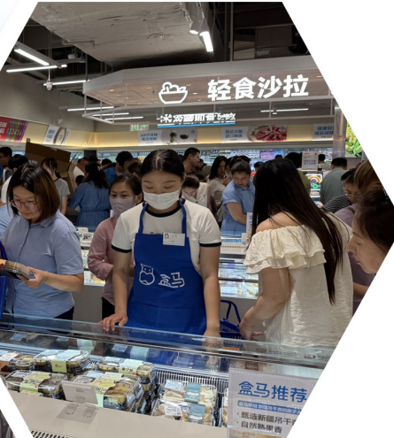
↑ 金马鲜生销 售火爆。