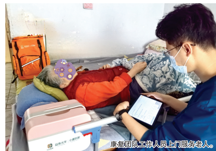
康复团队工作人员上门服务老人。

5月18日上午,山东健康烟台新曙光康复医院“小康到家”上门服务团队敲开了芝罘区厚安街王奶奶的家门,一月一次的康复训练如约而至。