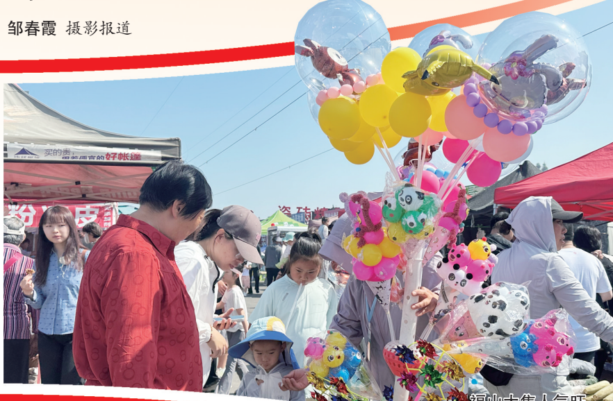
福山大集上的精彩表演。