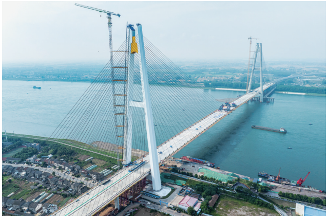
5月15日拍摄的枝江长江大桥施工现场(无人机照片)。

5月15日，由湖北交投集团投资、蜀道集团四川路桥和中交二公局联合承建的枝江长江大桥施工现场迎来关键节点——随着最后一块钢箱梁精准就位，这座“世界级”斜拉桥在江心完成最后“牵手”，标志着枝江长江大桥顺利合龙，为2026年下半年项目建成通车奠定了重要基础。百里洲是长江枝江段一座大型江心洲，面积约228平方公里，人口近10万人。长期以来，洲上的居民出行只能依靠轮渡。大桥建成通车后，百里洲两岸群众过江时间由数小时缩短至5分钟，彻底破解当地长期存在的出行难题，为区域协同发展打通关键脉络。 据新华社电