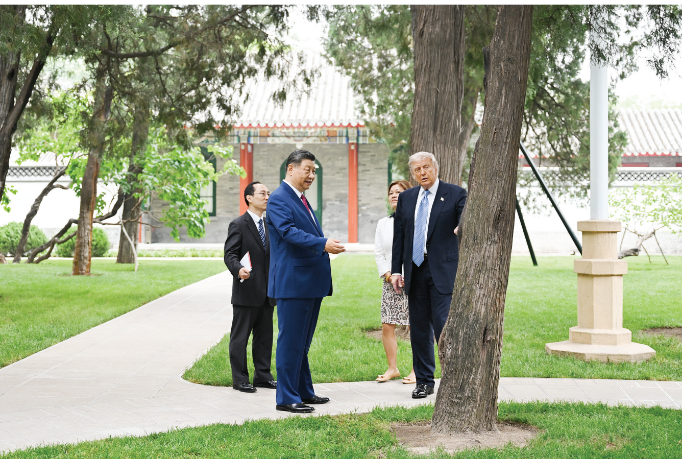
5月15日上午，国家主席习近平在中南海同美国总统特朗普举行小范围会晤。这是特朗普抵达时，习近平热情迎接。

同美国总统特朗普在中南海小范围会晤，双方要落实好我们达成的重要共识，珍惜当前来之不易的良好势头，把准方向、排除干扰，推动两国关系稳定发展