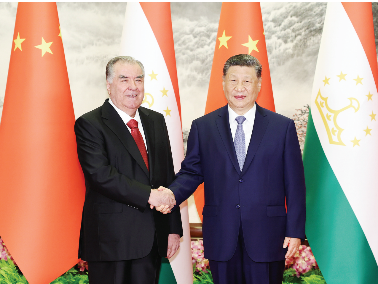
5月12日下午，国家主席习近平在北京人民大会堂同来华进行国事访问的塔吉克斯坦总统拉赫蒙举行会谈。新华社

新华社北京5月12日电 5月12日下午，国家主席习近平在北京人民大会堂同来华进行国事访问的塔吉克斯坦总统拉赫蒙举行会谈。