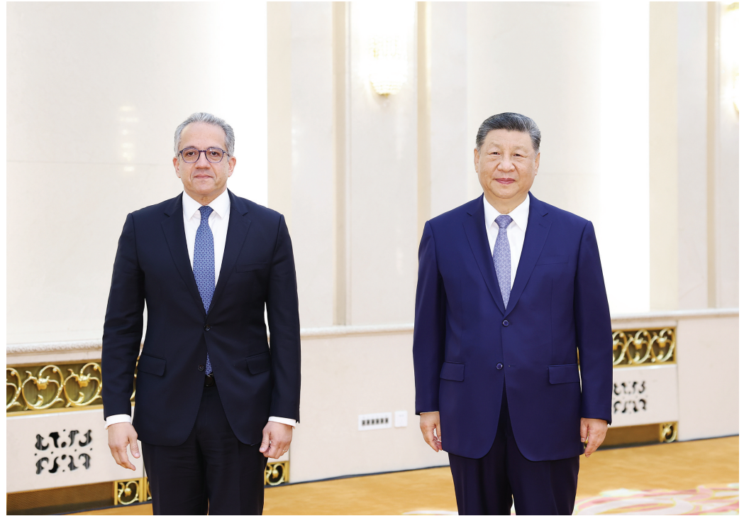
5月12日下午，国家主席习近平在北京人民大会堂会见联合国教科文组织总干事阿纳尼。新华社

新华社北京5月12日电 5月12日下午，国家主席习近平在北京人民大会堂会见联合国教科文组织总干事阿纳尼。