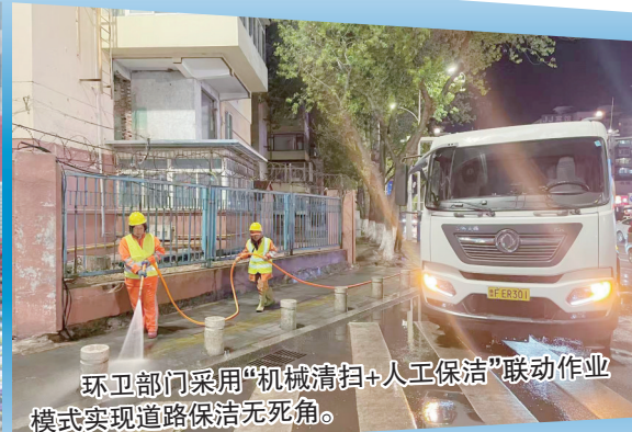
环卫部门采用“机械清扫+人工保洁”联合作业模式实现道路保洁无死角。