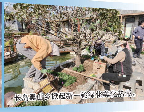
长岛黑山乡掀起新一轮绿化美化热潮。