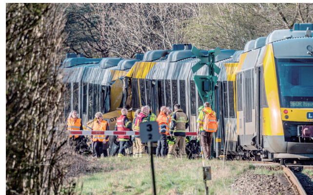
4月23日，在丹麦首都哥本哈根北部，救援人员在火车相撞事故现场聚集。据丹麦媒体23日报道，两列火车当天在丹麦首都哥本哈根附近相撞，已造成17人受伤，其中4人重伤。