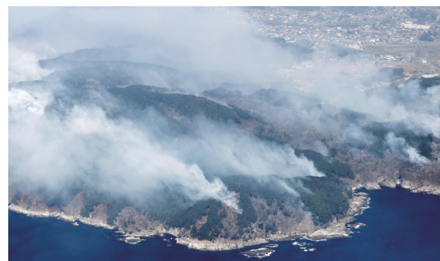
这是4月23日在日本岩手县大槌町航拍的山林火灾现场。据日本共同社23日报道，岩手县大槌町22日发生山林火灾，截至23日6时，过火面积已达200多公顷，7栋建筑在火灾中受损，町内中小学全部停课。