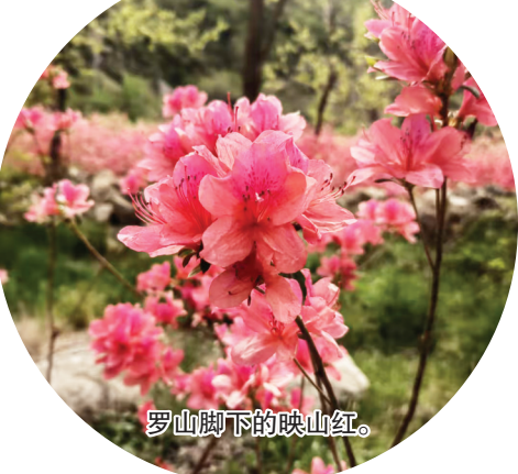
罗山脚下的映山红。

走进罗山,可实地体味山以金贵的奥妙,感受金甲天下的荣耀,领略黄金文化的风采,体味生产和保卫黄金的艰辛与神圣,并悟悟一理:倘若观天察地只取其表而视其里,那就首肯首议,“不识庐山真面目”了。