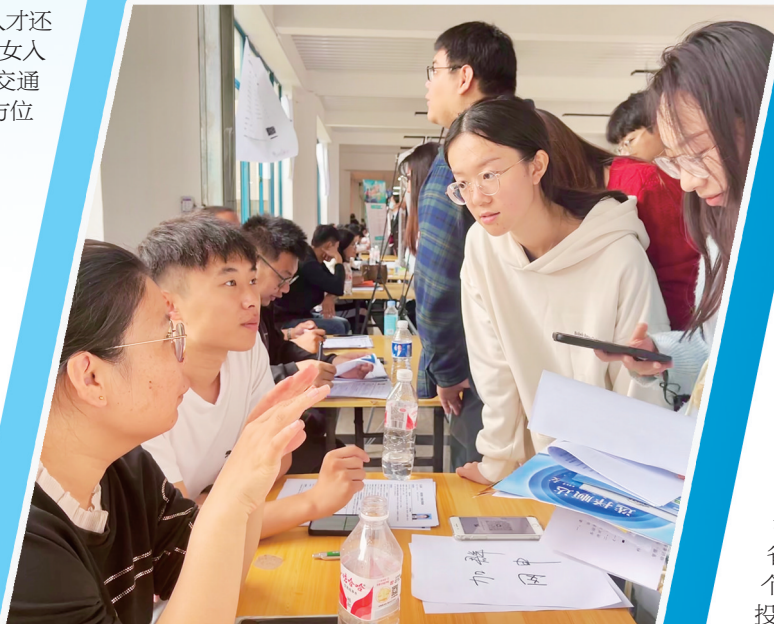
千企万岗进校园活动