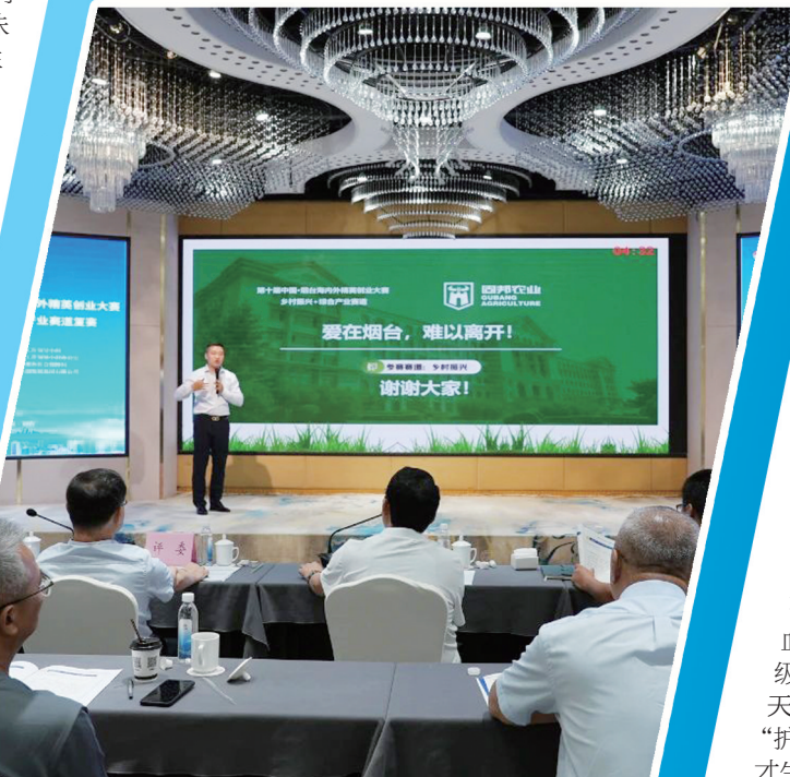
第十届中国·烟台海内外精英创业大赛项目路演现场