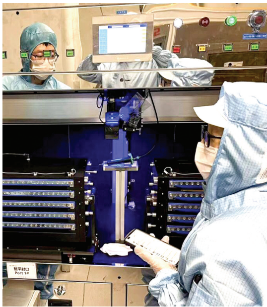
烟台光电显示材料研发测试公共服务平台工作人员正在进行材料测试。

“我们将支持企业面向产品试制、技术优化、检测验证等产业需求，提升中试公共服务能力，培育打造一批国家级、省级制造业中试平台。”烟台黄渤海新区工信科技局相关负责人表示。