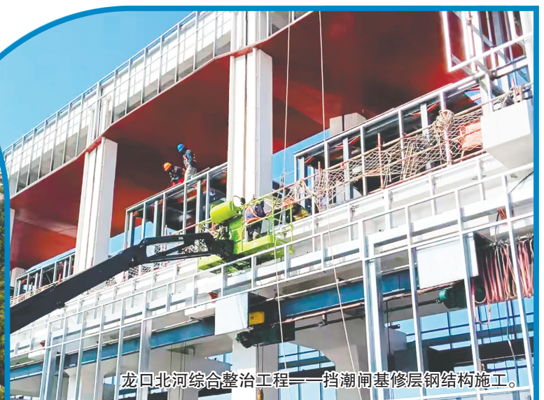
龙口北河综合整治工程——挡潮闸修层钢结构施工。