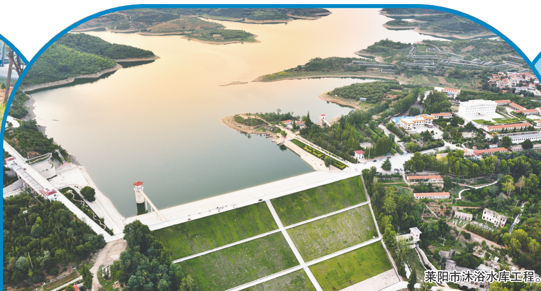
莱阳市沐浴水库工程。