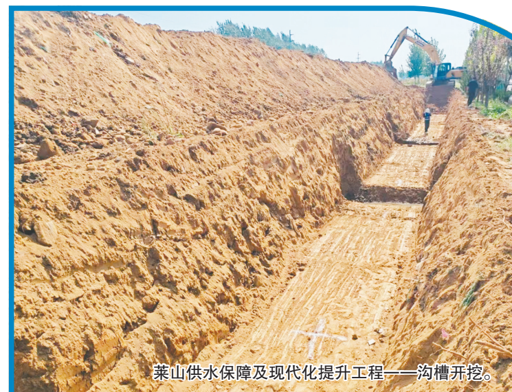
莱山供水保障及现代化提升工程——沟槽开挖。

细化开工方案、压实属地责任,市水利局主动靠前服务,深入一线协调解决用地审批、资金筹措、手续办理等各类堵点难点问题,以“店小