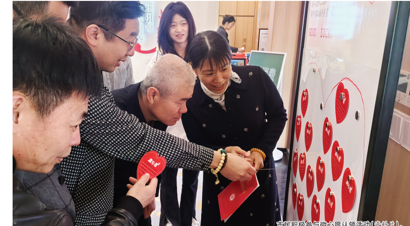
市民积极参与微心愿认领活动(资料片)。

本报讯(YMG全媒体记者 刘晓阳 通讯员 宫新杰)近日,山东省慈善工作会议在德州召开。烟台市芝罘区民政局作为全省唯一县级单位,在会上作题为《厚植善土、多维发力、奋力绘就“向善果地”新图景》的典型发言,全面展示慈善事业高质量发展的“芝罘经验”。