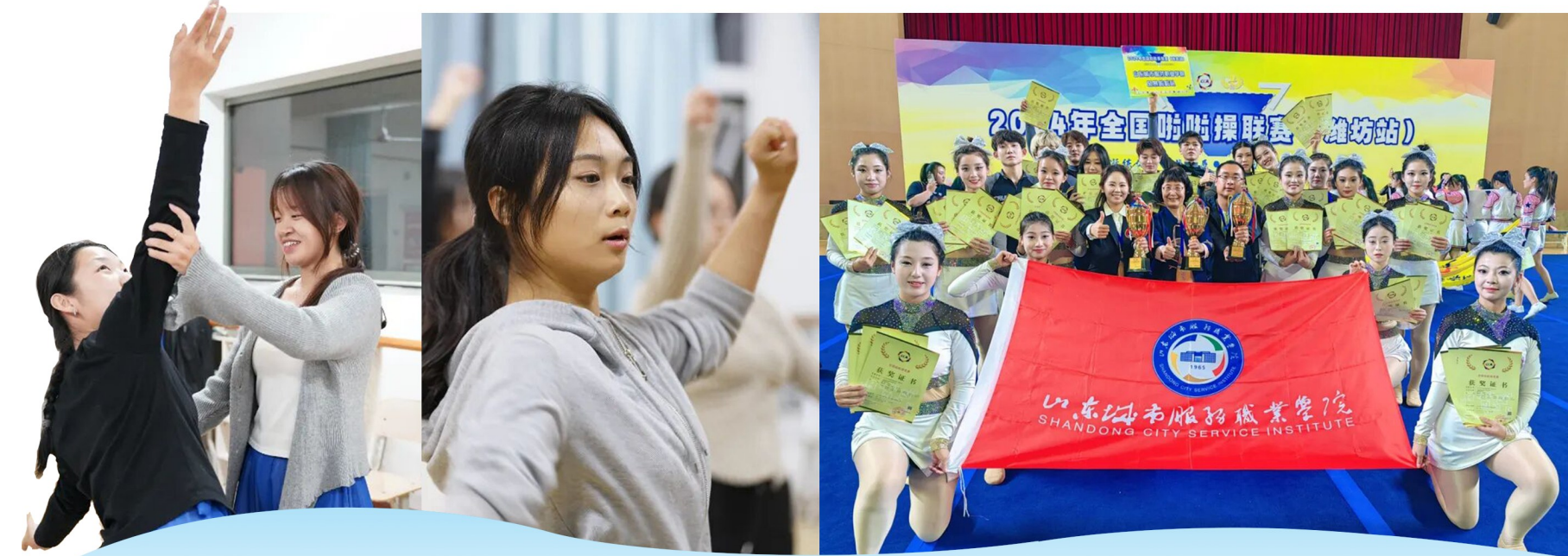
山东城市服务职业学院啦啦操团队

非遗与体育共生，文化与健康同行。学院以传统体育非遗为纽带，让健康校园既有青春活力，更有深厚文脉底蕴。