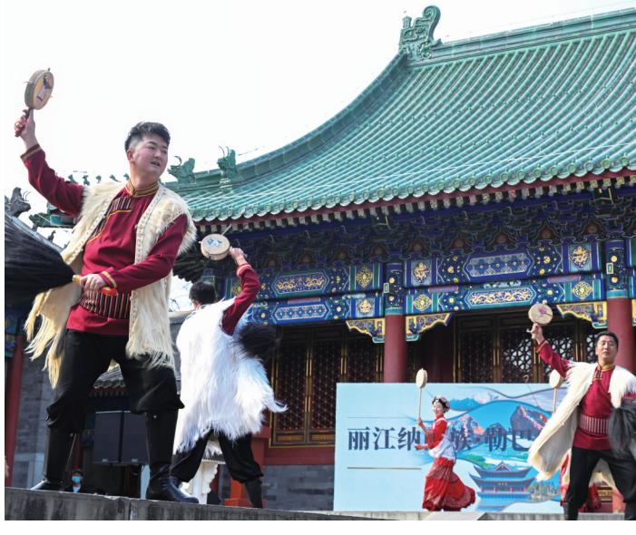
3月30日，讲述丽江木氏土司维护国家统一、促进民族交融事迹的“和美流芳——丽江木府历史文化主题展”在恭王府博物馆开幕。