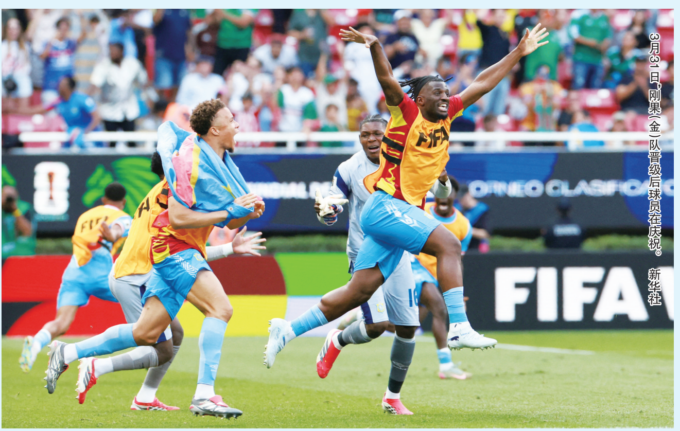
3月31日，刚奥(金)队晋级后球员在庆祝。

至此，世界杯预选赛欧洲区比赛全部结束，16个参赛席位各有归属。2026美加墨世界杯将于6月11日至7月19日举行，共有48支队伍参赛。