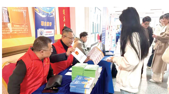
专业人员对毕业生提供政策解读与就业指导服务。

招聘活动现场还设有就业帮扶、法律服务等专区,安排专业人员提供政策解读与就业指导服务,并提供AI模拟面试间和就业测评工具。此外,活动还集中宣传了工会就业帮扶政