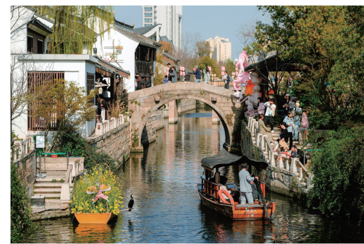
3月28日，2026年上海市市民文化节开幕暨“城市美育”为民办实事项目启动活动在上海市青浦区蟠龙新天地商圈举行。同时，“城市美育日”活动在全城开展，各区分会场上演了多姿多彩的美育活动，让市民在日常生活中感知美、参与美、创造美。 新华社

训练场上，20余名十六七岁的球员正在训练，备战即将开始的中国足协青少年足球锦标赛男子足球第二阶段的比赛以及中超联赛大区赛。他们的足球梦想，正从这里起飞。 新华社合肥3月29日电