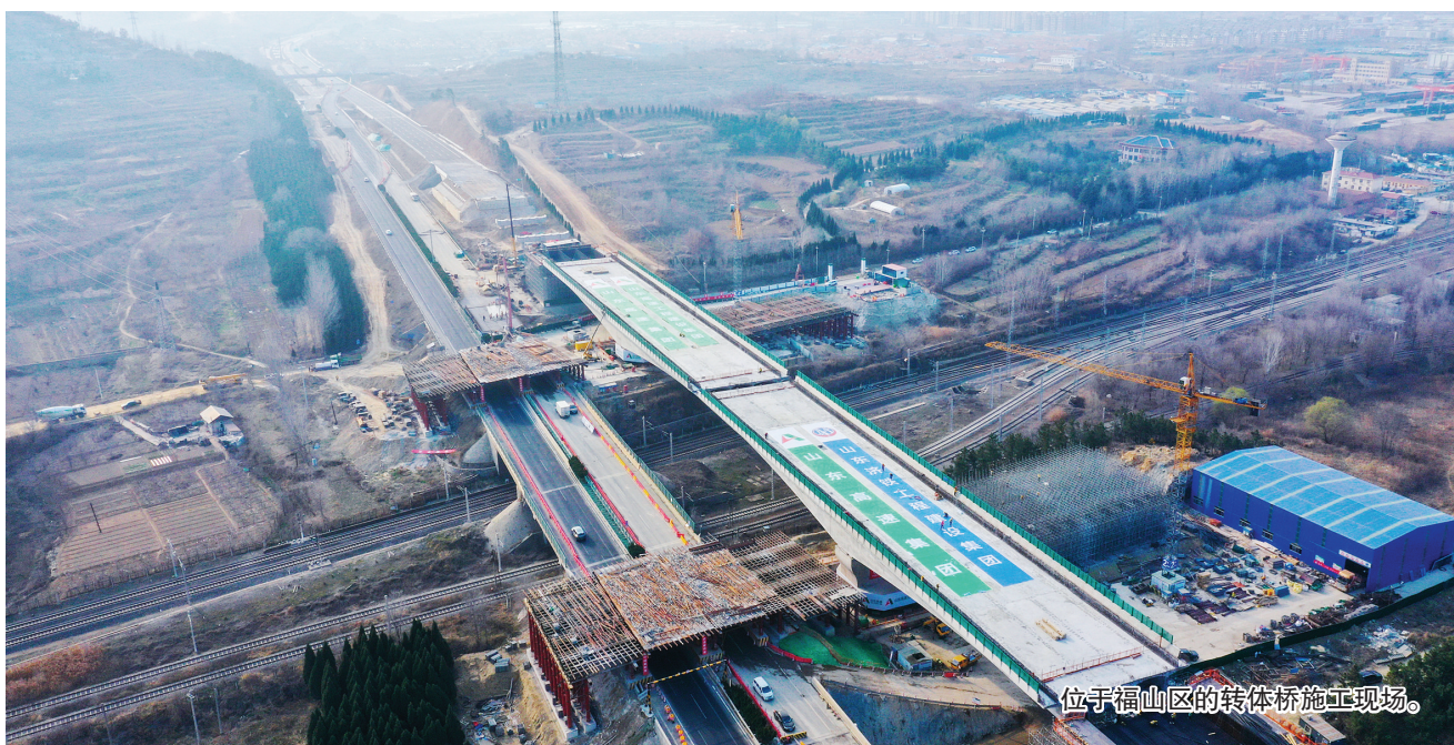
位于福山区的转体桥施工现场。