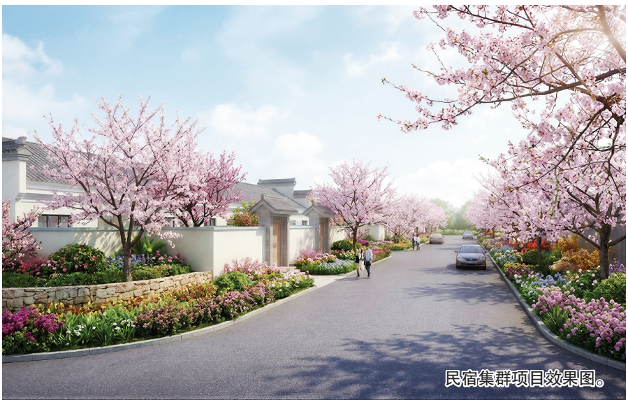
民宿集群项目效果图。据悉,项目由山东农旅新产业发展集团全权投资建设,分三年稳步推进。2026年计划投资1000万元,完成项目全流程手续,建成30栋民宿主体并打造精品样板间;2027年计划投资1100万元,

本报讯(YMG全媒体记者 王宏伟) 近日,灵湖时光·铎山前康养旅居民宿项目奠基仪式在莱阳市照旺庄镇铎山村举行。随着莱阳首个整村开发的康养民宿集群破土动工,一座集休闲度假、健康养生、乡村体验于一体的康养目的地即将崛起。