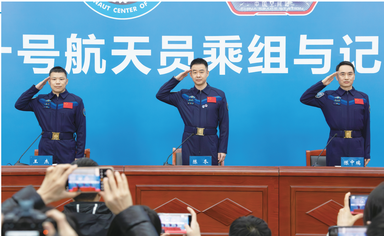
1月16日,航天员陈冬(中)、陈中瑞(右)、王杰(左)敬礼致意。1月16日下午,中国航天员科研训练中心在北京航天城举行神二十乘组与记者见面会,航天员陈冬、陈中瑞、王杰太空归来后首次公开亮相。新华社