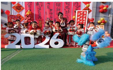
1月14日，四川省遂宁市高新区瑰宝明珠幼儿园举办迎新新春非遗庙会，一只身披舞狮服的机器狗亮相，为师生送来温馨祝福。

廉洁自律没有“退休日”，纪律约束没有“休止符”。遏制“余威腐败”，既要强化对离退休干部的常态化教育，引导其清醒认识“晚节”的价值，更要健全离职从业限制、利益冲突排查、跨部门协同监管等刚性制度，让“余威”无处逞能，“余利”无机可乘。唯有如此，才能守护好权力廉洁运行的防线，让风清气正的政治生态持续巩固。