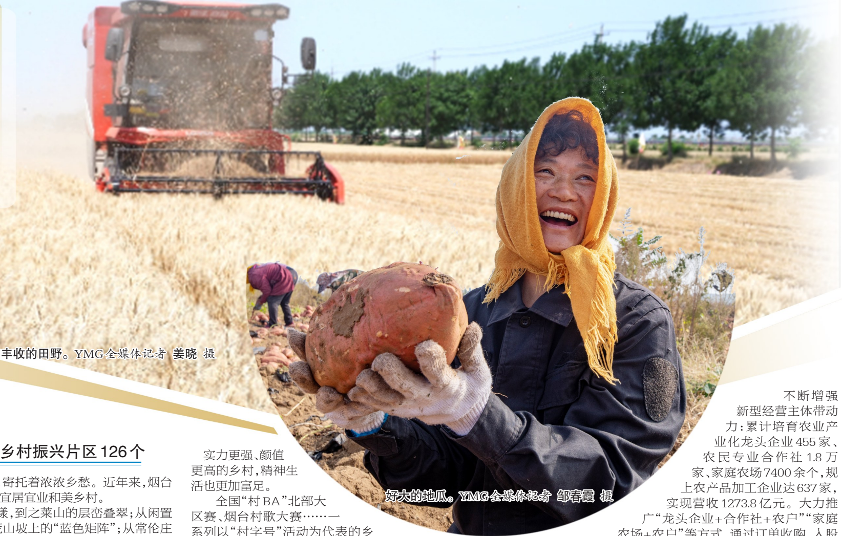
丰收的田野。

“十四五”以来，全市农业农村部门锚定建设农业强市目标，突出特色、做强产业，扎实推进乡村振兴各项工作，全市农林牧渔业总产值达到1319.5亿元，较“十三五”末增长了23%，为建设万亿城市贡献了“三农”力量。