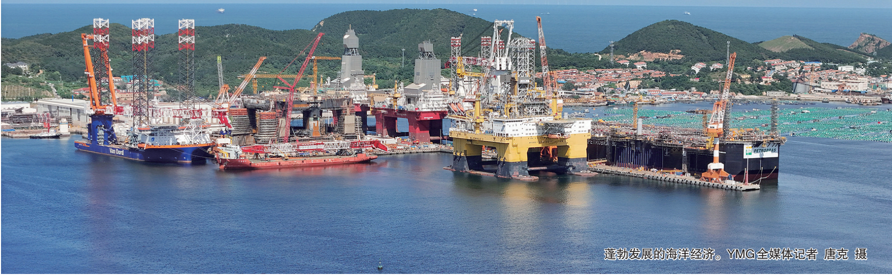
蓬勃发展的海洋经济。

岁末将至,烟台再迎盛事。12月4日,山东省绿色低碳高质量发展先行区建设工作推进会议将在烟台召开。这不仅是对烟台坚定不移走生态优先、绿色发展之路的肯定,更是推动全市产业向新、向绿、向未来的重要契机。