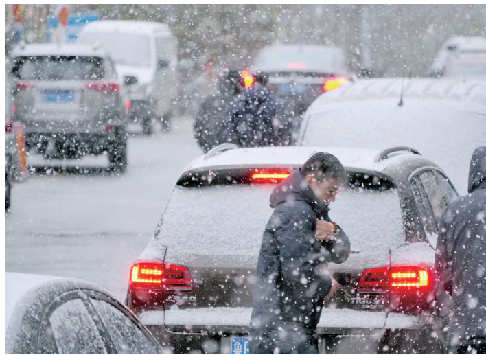
12月2日,人们冒雪出行。当日,受寒潮天气影响,烟台市迎来入冬后首场降雪。