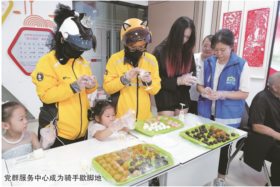
党群服务中心成为骑手歇脚地

牟平区网约配送行业党委高标准打造“烟小暖·红牟驿家”党群服务中心,安装人脸识别门禁系统,实现外卖骑手24小