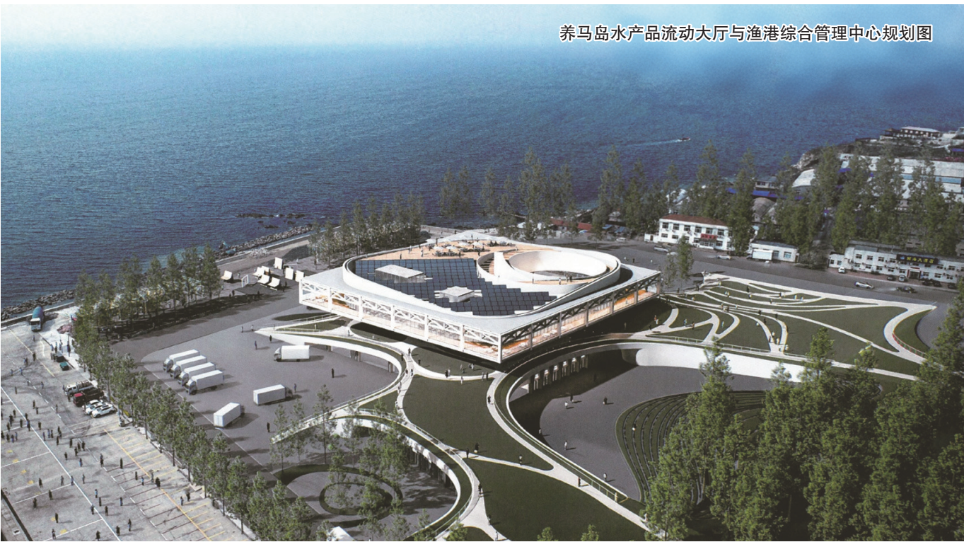
养马岛水产品流动大厅与渔港综合管理中心规划图

养马岛水产品流动大厅与渔港综合管理中心项目深度融合地域文化特色,以打造兼具历史底蕴与现代功能的公共空间为目标,致力于构建集渔业交易、文化体验与休闲服务于一体的高品质城市综合体。项目以二级水产品批发交易为主,通过科学规划与智慧化管理,形成辐射区域的现代化渔业交易枢纽,同时,也将为市民提供充满渔港风情的休闲活动场所。“依托岛西端的独特区位优势,项目同步规划多元商业服务空间,有机串联渔港交易与旅游服务功能,为渔旅融合发展搭