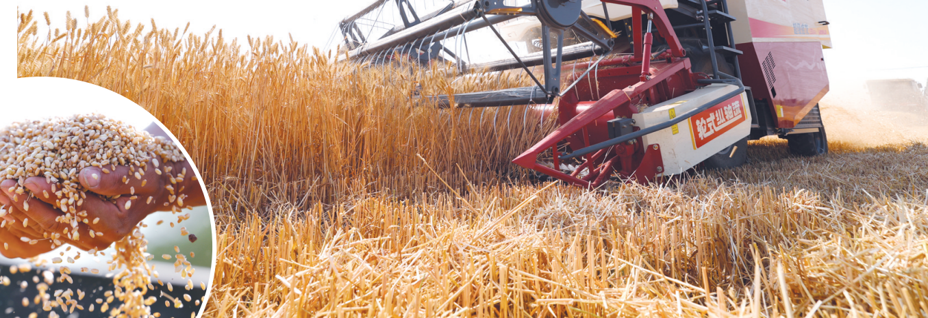
6月10日,河北省石家庄市栾城区柳林屯乡东牛村村民驾驶农机收割小麦。

外,各地持续推进高标准农田建设,不断提升耕地质量。业内专家介绍,通过高标准农田建设,粮食产能一般能提高10%左右。