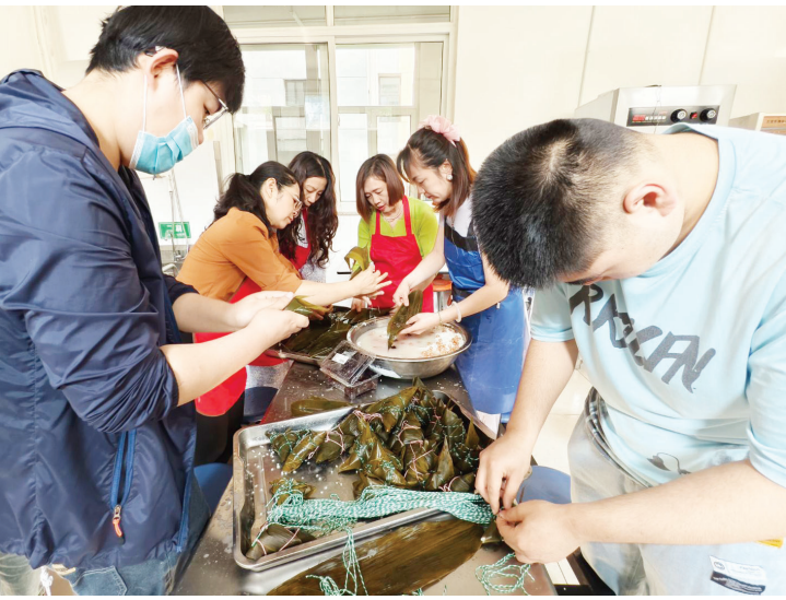
5月27日,招远市特殊教育学校组织师生共同开展包粽子活动,让特殊学生在动手实践中感受端午节的氛围和乐趣。

文化体验区将心理疗愈与传统技艺深度融合:漆画扇制作“如‘漆’而至”,参与者在一笔一画中沉淀心绪;“纸鸢寄梦”与“剪出精彩”环节,则通过手工创作激发成就感;“静心投壶”以传统游戏为载体,帮助学生在专注中找回内心的宁静,彰显“以文化疗愈心灵”的创新理念。心理游戏挑战区与互动区成为活动的“欢乐引擎”。“套中美好”与“甩掉烦恼”通过投掷游戏释放压力;“齐心协力”龙舟竞速与“鼓舞人心”团队击鼓项目让参与者在合作中感受集体的凝聚力。宣传引导区通过科普展板、互动问答等形式,普及心理健康知识,营造“全员关注心理成长”的良好氛围。