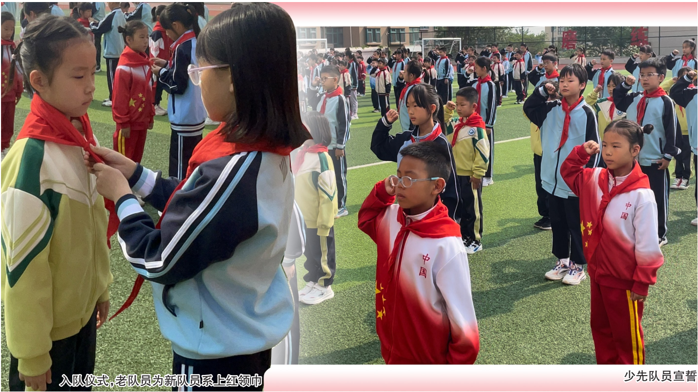
入队仪式,老队员为新队员系上红领巾