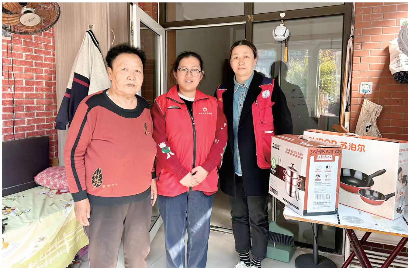
福新街道“送愿小分队”将爱心送达。