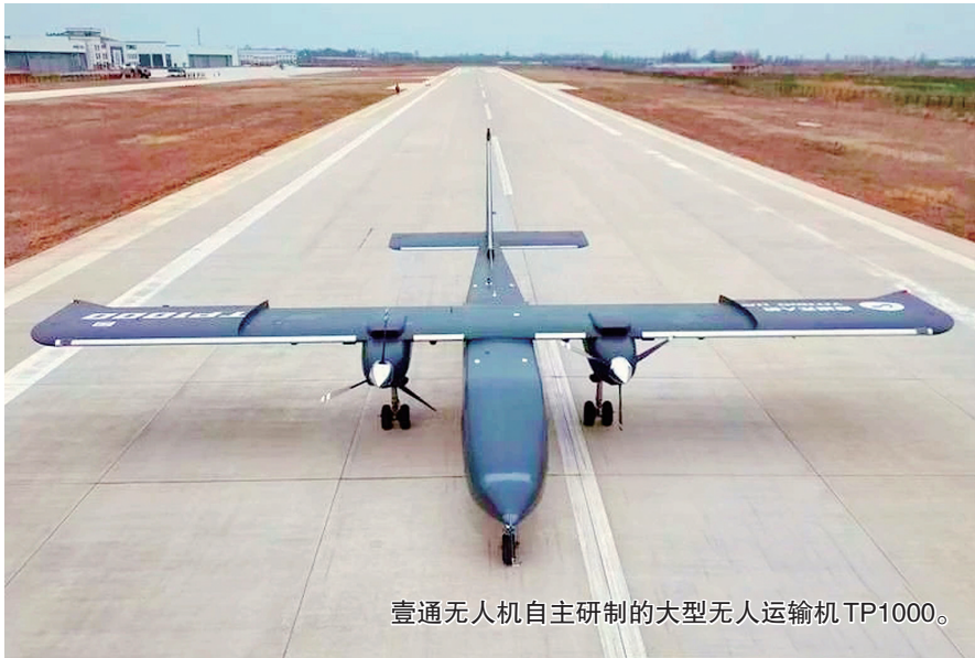
壹通无人机自主研发的大型无人运输机TP1000。

走进位于上海大街的壹通无人机厂区,一架通身黑色的大型无人机吸引了记者的目光。这架翼展15米、高4米多的