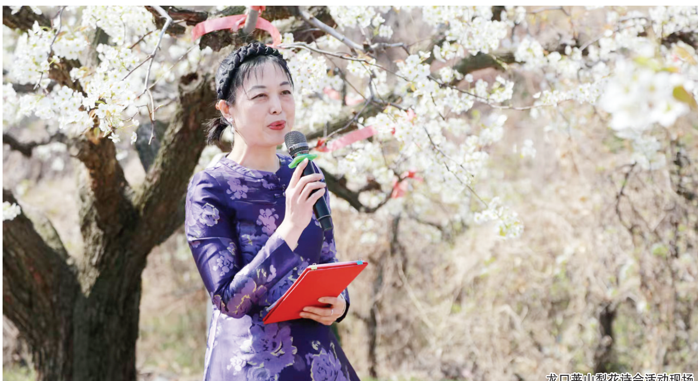
龙口莱山梨花诗会活动现场

“柳色黄金嫩,梨花白雪香。”在这春意正浓的美好时节,洁白的梨花绽放在枝头,为大地绘就了一幅清新淡雅的画卷。4月11日,一年一度的龙口莱山梨花诗会在七甲镇梨花峪浪漫启幕,吸引了龙口市诗词学会、书协、美协、摄协、音协、民协及东莱印社等文化艺术界的100多位人士共赴这场春日诗约。在美丽的梨园花海中,大家用诗词、音乐、书画等艺术形式歌颂伟大祖国,赞美新时代,抒发对家乡的热爱。