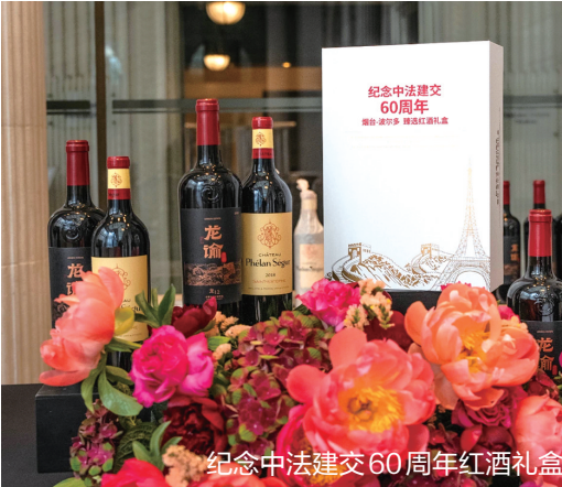
纪念中法建交60周年红酒礼盒