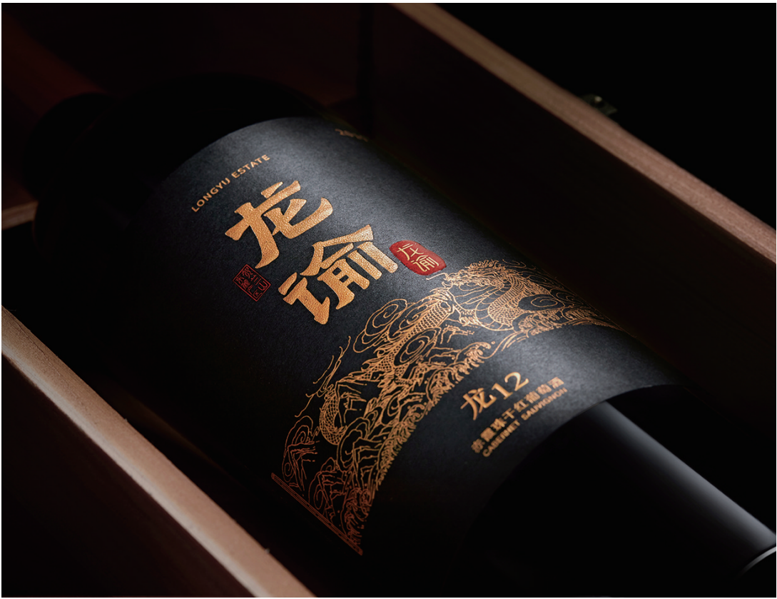
龙谕·龙12赤霞珠干红葡萄酒

在2024年5月,纪念中法建交60周年红酒礼盒正式发布,百年张裕旗下的高端战略品牌——龙谕入选此次红酒礼盒,进一步证明了中国葡萄酒在外交礼仪中的地位。