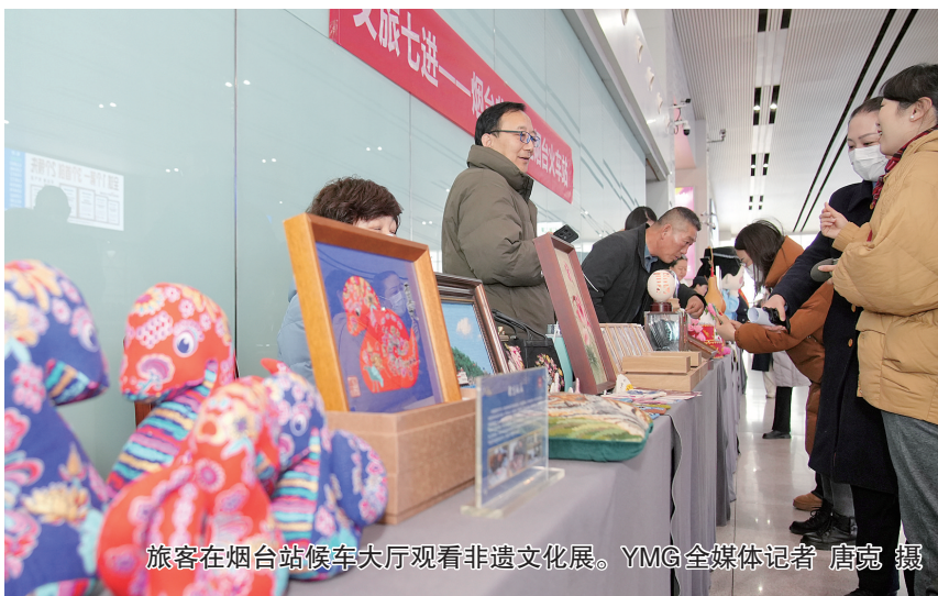
旅客在烟台站候车大厅观看非遗文化展。

本报讯(YMG全媒体记者 张孙小 通讯员 王丹)2025蛇年春节是首个“世界非遗版”春节。1月22日,山东中铁文旅发展集团有限公司联合烟台文旅局,在潍烟高铁沿线的招远站、龙口市站、蓬莱站及烟台站4座车站举办非遗文化展,向旅客展示丰富多彩的非遗文化和文旅产品,营造喜庆祥和的节日氛围,