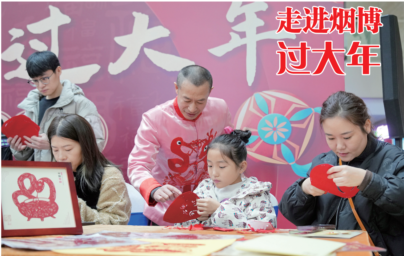
1月22日,在烟台市博物馆,市民们在“烟台剪纸”非遗传承人的指导下学习剪纸。当日,“走进烟博过大年”活动在市博物馆启动,一系列丰富多彩的活动将充实市民的节日文化生活,营造浓厚的节日氛围。

展会时间:1月15日(腊月十六)—1月23日(腊月廿四)9:00—16:00;展会地点:烟台国际博览中心(莱山区);公交线路:17路、51路、67路、68路、105路、566路、游1路到烟台国际博览中心站下车;自驾路线:导航至“烟台国际博览中心”。