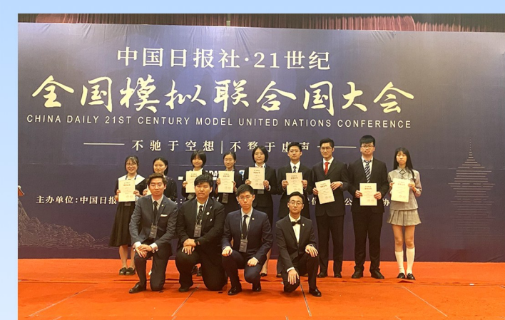
参加全国模拟联合国大会。