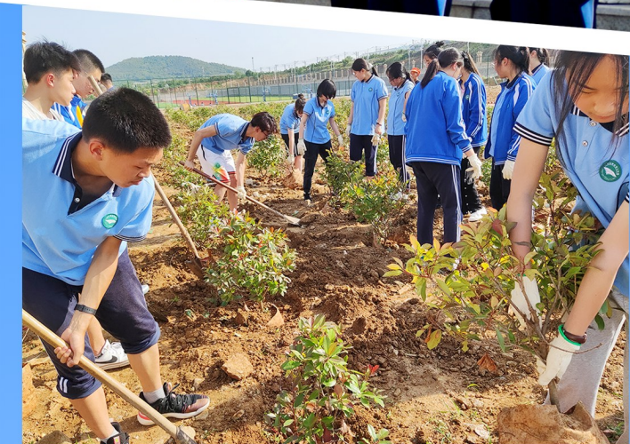
定期开展劳动教育。