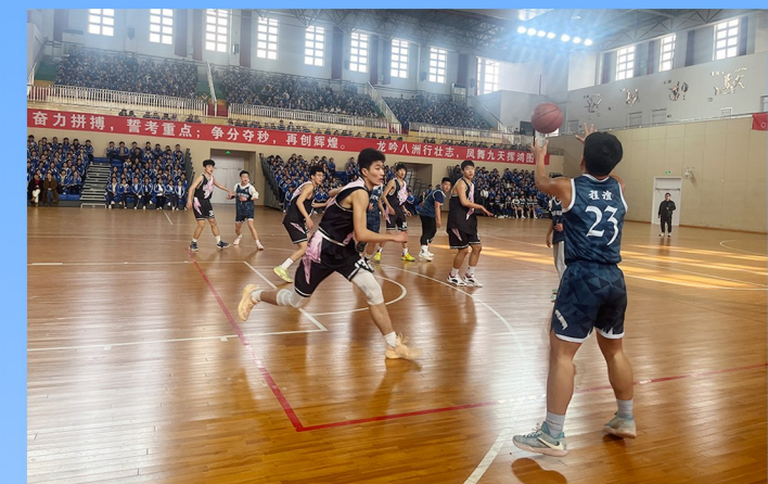
组织“复光杯”篮球赛。