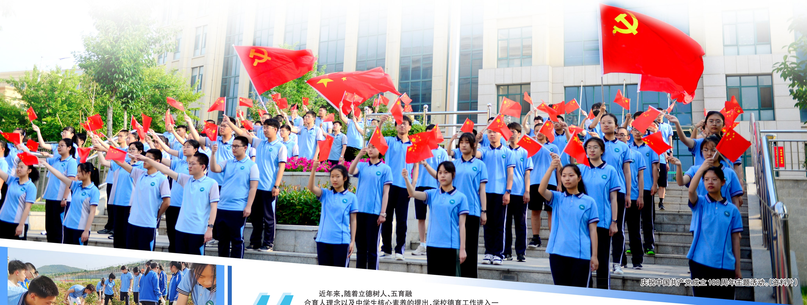
庆祝中国共产党成立100周年主题活动。(资料片)