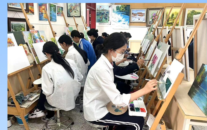
社团活动——油画社团。