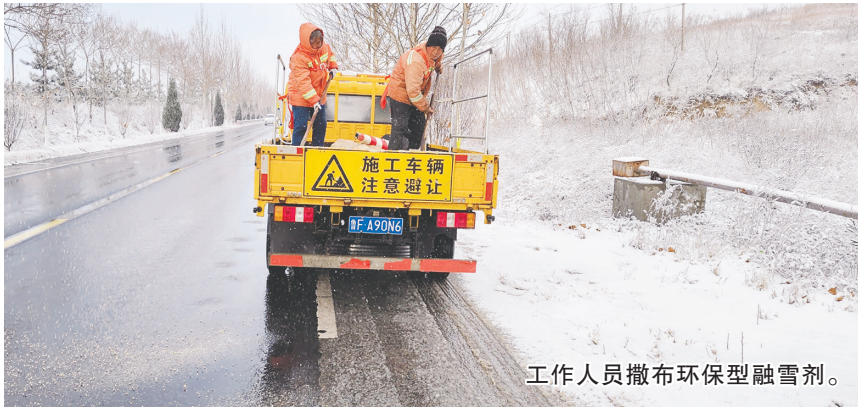
工作人员撒布环保型融雪剂。

本报讯(YMG全媒体记者 邹春霞 通讯员 查珊珊 王芳 王超 摄影报道)为确保居民安全出行,福山“清雪大军”以雪为“令”第一时间出动机械和人员迅速展开清雪作业,确保道路畅通。 福山区综合行政执法局实行领导带班和24小时值班制度,成立应急小分队和督导组,共配备滚刷扫雪机39台,推雪铲39台,撒布机21台,储备环保型融雪剂900余吨,清雪值守人员120余名。 截至记者发稿时,福山城区市政道路未积雪,道路畅通。 记者从福山区交通运输局获悉,全区县级道路正常通行,目前正安排机械清理路边雪浆,安排养护人员上路巡查,及时发现隐患,全力保障道路安全畅通。