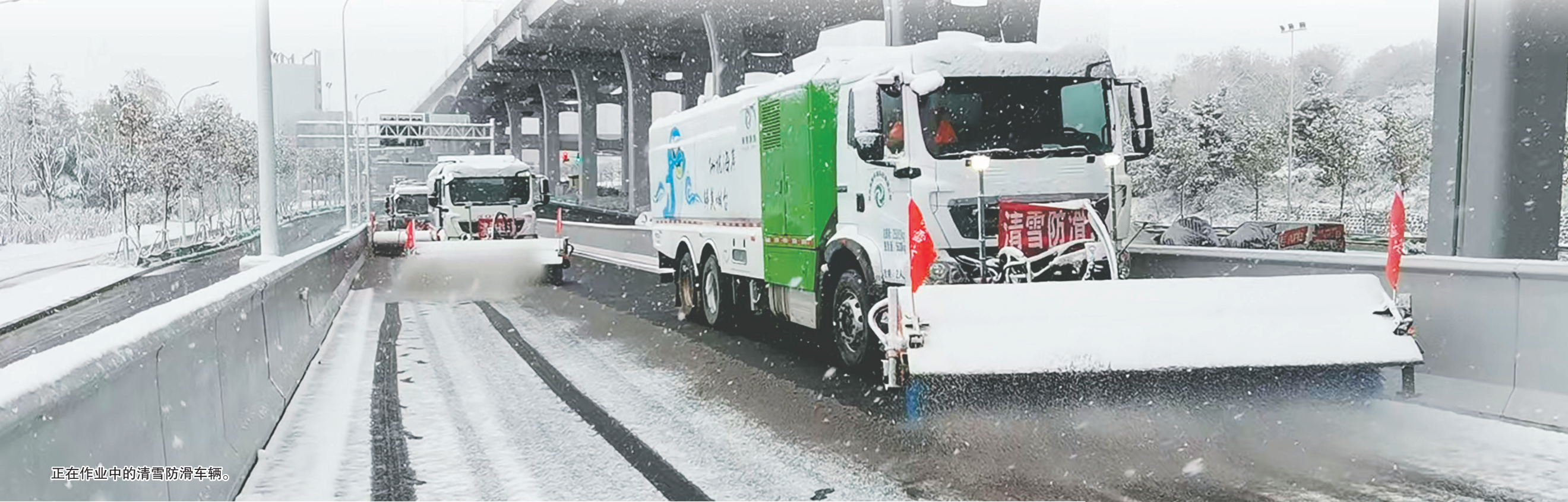
正在作业中的清雪防滑车辆。