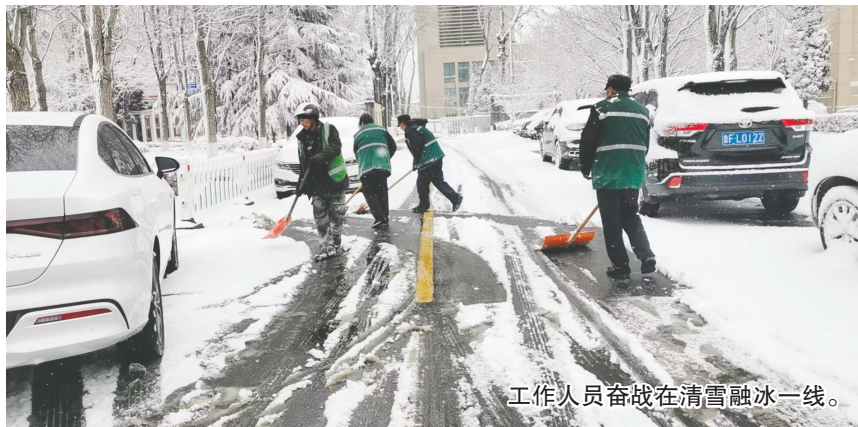
工作人员奋战在清雪融冰一线。

本报讯(YMG全媒体记者 殷新 通讯员 张明伟 摄影报道)昨日,一场降雪为招远增添了一抹亮丽色彩,同时也影响了市民的生活秩序与出行安全。为有效应对此次降雪,招远市综合行政执法局积极联动,以雪为令,迅速启动应急预案,全力投入到除雪工作中,确保市民出行安全和道路畅通。 “雪情”就是命令,招远市综合行政执法局组织环卫园林市政等人员立即行动,不畏严寒,奋战在清雪融冰一线。出动设备46台、清雪人员580余人,根据“保交通、保出行、保民生”的工作原则,采取机械化除雪和人工扫雪相结合的作业方式,对主干道、坡道路面、医院、大型商超门前、桥面等重点区域进行优先保障,确保重点部位的积雪得