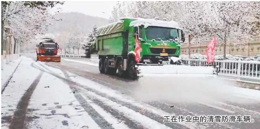
正在作业中的清雪防滑车辆。

本报讯(YMG全媒体记者 徐睿 通讯员 于丰源 王永平 摄影报道)受冷空气影响,12月7日,莱山区出现一次强降雪天气。莱山区综合行政执法局、莱山公路中心等部门以雪为令,及时展开清雪作业。 为有效应对本次降雪天气,莱山区综合行政执法局第一时间启动清雪防滑应急预案,组织清雪滚刷、U型板、大型推雪板、撒布机等各类车辆设备213台,机关干部及清雪队员400余名,从6日晚开始值守待命。7日下午1点半开始出现持续强降雨雪,该局及时组织人员及设备对部分跨线桥、匝道、桥梁、坡路等易结冰打滑路段展开清雪作业,确保市民出行安全。 12月6日晚至目前,莱山公路中心