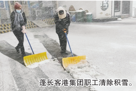
蓬长客港集团职工清除积雪。

本报讯(YMG全媒体记者 张孙小嫒 通讯员 崔凯莉 摄影报道)12月7日,烟台迎来降雪,蓬长客港集团干部职工以雪为令、闻雪而动,人机配合、高效协同,蓬长两港区到处都是除雪破冰的火热劳动场面。 长岛港区组织干部职工按照先主道、后辅路的顺序,实行人工铲雪与铲车配合,巡回清扫,随下随清,确保“雪中路通、雪停路清、雪后不滑”,保障港区通行顺畅,以“硬核担当”守护旅客安全出行。 蓬莱港区,机关总部与蓬港分公司高效联动、协同作战。蓬港分公司重点清理了进出港通道、站前广场、现场作业区、车辆安检通道等关键区域,为雪后旅客出行开辟安全通道,保障通行安全;机关总部集中清理了办公楼院内、员工停车场等区域,保障干部职工安全出行。