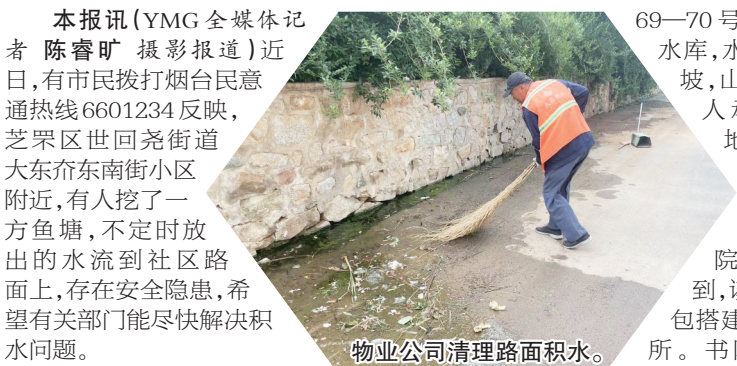
物业公司清理路面积水。

本报讯(YMG全媒体记者 陈睿旷 摄影报道)近日,有市民拨打烟台民意通热线6601234反映,芝罘区世回尧街道大东芥东南街小区附近,有人挖了一方鱼塘,不定时放出的水流到社区路面上,存在安全隐患,希望有关部门能尽快解决积水问题。 昨日上午10点,记者来到市民反映的地点看到,在大东芥东南街