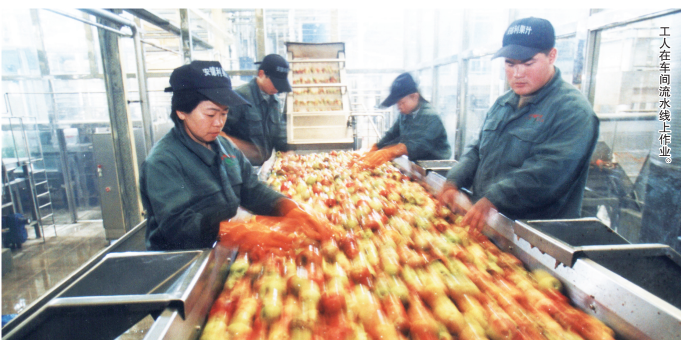
工人在车间流水线上作业。

在1999年美国对中国浓缩果汁的反倾销案中,安德利积极应诉,并成功胜诉,取得了全国唯一的“零税率”。在这些年的发展中,安德利也展现出令人钦佩的公益精神,用实际行动践行着企业的社会责任,彰显出企业的担当与情怀。安德利把“小苹果”做大做强,先后在全国8个苹果生产大省建设了9个浓缩果汁加工基地,拥有18条世界一流浓缩果汁、果浆生产线和一条饮料灌装线,年可加工果品100万吨;安德利把“小苹果”榨干吃净,充分利用果汁加工产生的皮渣资源,成功开发了亚洲最大、世界单体第二、世界第四的果胶生产基地,拥有3条世界一流生产线,年可产果胶成品10000吨,产品销往世界一百多个国家地区。目前,安德利从单纯的果汁加工发展到三大主营业务板块,包括果汁、果胶生产销