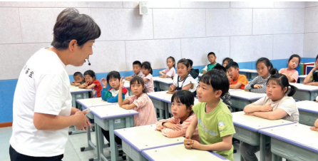
通过互动问答等方式让孩子们了解防溺水知识。

此次防溺水宣传活动中是回里镇新时代文明实践安全教育系列活动之一，深入推进了回里镇全环境立德树人建设，进一步号召了更多党员教师充分发挥模范带头作用，积极参与防溺水安全教育宣传工作。